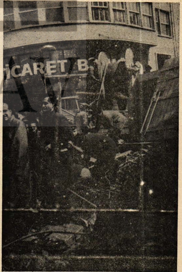
Biz haberleşme işçileri, ekmeğe, hürriyet mücadelemizde bir adım daha attık diğer devrimci işçi kardeşlerimizle yan yana olmak için. Hazırız kardeşler dedik ekmeğe kavgamızda beraber yürümeye hazırız.

Yeni Haber-İş devrimci (Sonu Sayfa 4 de)